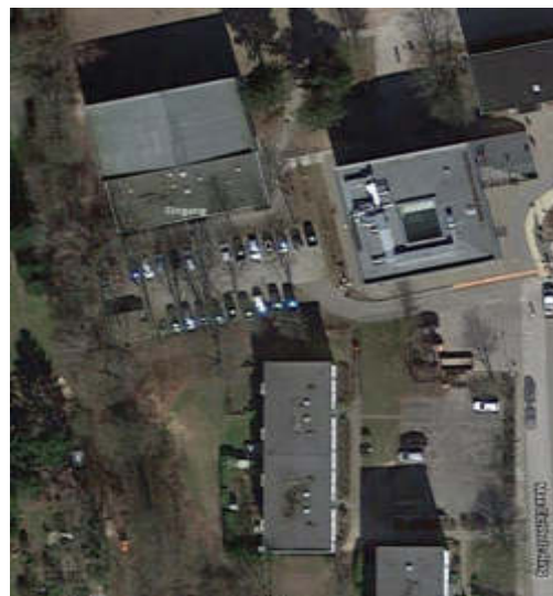
Halle Max-Eichholz-Ring 25

Der Zugang zur Halle erfolgt über den Parkplatz vor der Halle